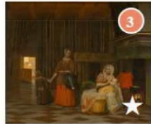
FRAU MIT KIND UND DIENSTMAGD um 1663/1665 Künstler: Pieter de Hooch Gemäldegalerie, Kabinett 19