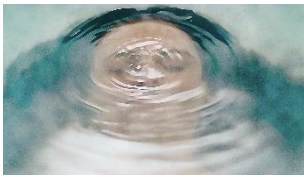
Yasaman Hasani Narziss Videostill © Yasaman Hasani

Pressefotos zur aktuellen Berichterstattung stehen zum Download auf unserer Website press.khm.at bereit.