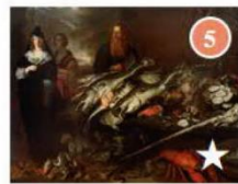
GROSSER FISCHMARKT um 1654/1655 Künstler: Joachim von Sandrart Gemäldegalerie, Saal XII