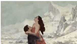
Yasaman Hasani Im Winter Videostill