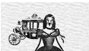
Yasaman Hasani Ludmilla Videostill