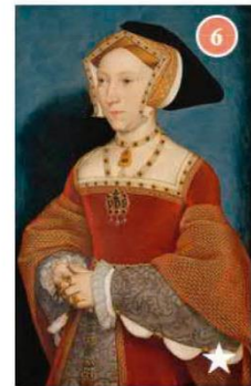
JANE SEYMOUR (UM 1509-1537) um 1536/1537 Künstler: Hans Holbein d. J. Gemäldegalerie, Saal IX