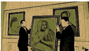
Yasaman Hasani 5976 Videostill © Yasaman Hasani