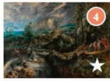
GEWITTERLANDSCHAFT MIT JUPITER, MERKUR, PHILEMON UND BAUCIS um 1620/1625 bis um 1636 Künstler: Peter Paul Rubens Gemäldegalerie, Saal XIII