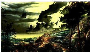
Yasaman Hasani Neuseelandschaft Videostill