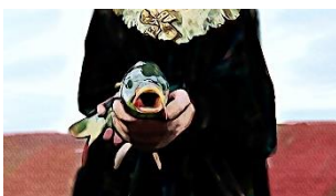
Yasaman Hasani Die Rückkehr der Yamaboushi oder Shifting Baselines Videostill