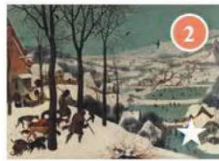
JÄGER IM SCHNEE (WINTER) 1565 datiert Künstler: Pieter Bruegel d. Ä. Gemäldegalerie, Saal X