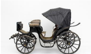
Sommerwagen von Kaiser Franz Joseph, sogenannte Leib-Victoria Nr. 10 Gebrüder Kölber (Budapest), 1896 Zustand vor der Restaurierung Kunsthistorisches Museum Wien, Wagenburg © KHM-Museumsverband