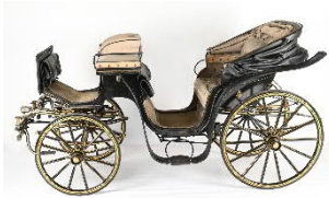
Sommerwagen von Kaiser Franz Joseph, sogenannte Leib-Victoria Nr. 10 Gebrüder Kölber (Budapest), 1896 Zustand nach der Restaurierung Kunsthistorisches Museum Wien, Wagenburg

Pressefotos zur aktuellen Berichterstattung stehen zum Download auf unserer Website http://press.khm.at bereit.