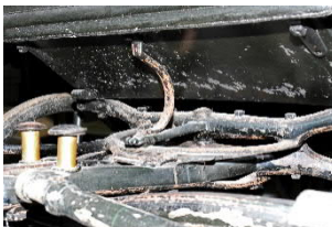
Sommerwagen von Kaiser Franz Joseph, sogenannte Leib-Victoria Nr. 10 Gebrüder Kölber (Budapest), 1896 Detail Fahrgestell vor der Restaurierung Kunsthistorisches Museum Wien, Wagenburg