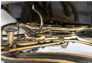
Sommerwagen von Kaiser Franz Joseph, sogenannte Leib-Victoria Nr. 10 Gebrüder Kölber (Budapest), 1896 Detail Fahrgestell nach der Restaurierung Kunsthistorisches Museum Wien, Wagenburg