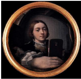
Francesco Mazzola gen. Parmigianino Selbstbildnis im Konvexspiegel mit Smartphone (Original: um 1523/1524)

Die Bilder sind für die aktuelle Berichterstattung frei und stehen unter press.khm.at zum Download bereit.