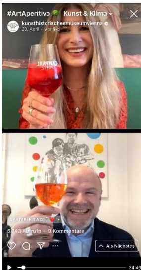
Screenshot #ArtAperitivo Kunst & Klima Instagram-Live-Talk-Reihe