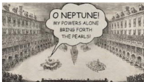
From Real Life into the World of Art Der Wettstreit von Luft und Wasser Animation / Filmstill