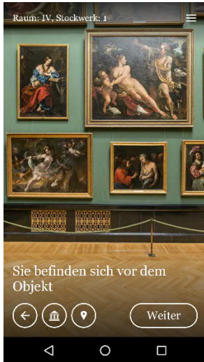
Screenshot KHM Stories App