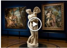
Tizians Frauenbild Video On Demand