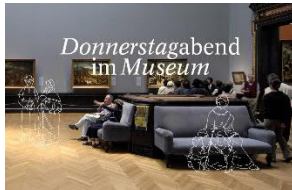
Donnerstagabend Im Museum Zoom & Facebook Live-Reihe