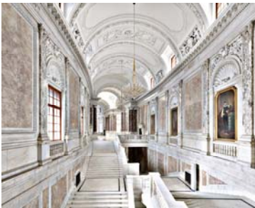
Kunsthistorisches Museum Wien, Neue Burg 2014 180 x 225 cm ©Massimo Listri