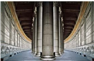
Altare della Patria Rom 1998 180 x 225 cm ©Massimo Listri