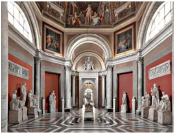
Musei Vaticani - Sala delle Muse Rom 2014 180 x 225 cm ©Massimo Listri