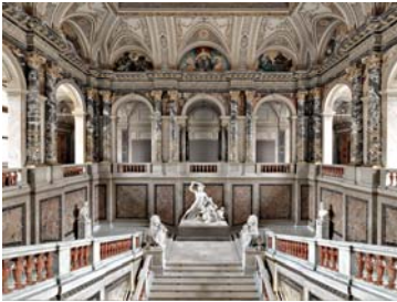
Kunsthistorisches Museum Wien 2014 180 x 225 cm

Die Bilder sind für die aktuelle Berichterstattung kostenlos und stehen zum Download bereit unter press.khm.at