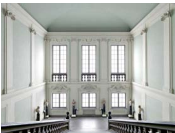
Uffizi - Salone Lorenese Florenz 2009 180 x 225 cm